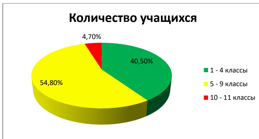
Диаграмма «Численность учащихся по ступеням в %»

В таблице приведена динамик учащихся по годам обучения.