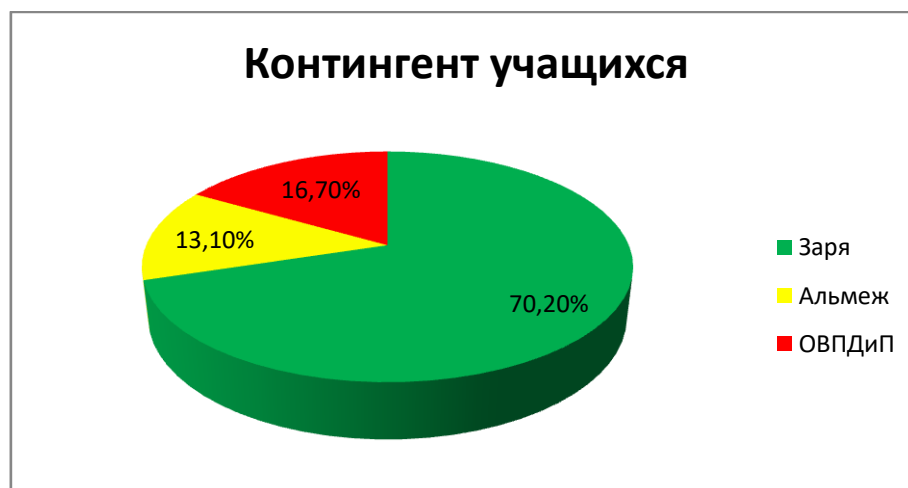
Диаграмма «Численный состав учащихся в %»

В школе обучается 84 учащихся, из них проживающих на территории Заринского сельского поселения – 59(70,2%) детей, проживающих в п. Альмеж – 11 (13,1%) детей, пребывающих в отделении временного пребывания детей и подростков КОГАУСО «Межрайонный КЦСОН в Подосиновском районе» – 14 (16,7%).